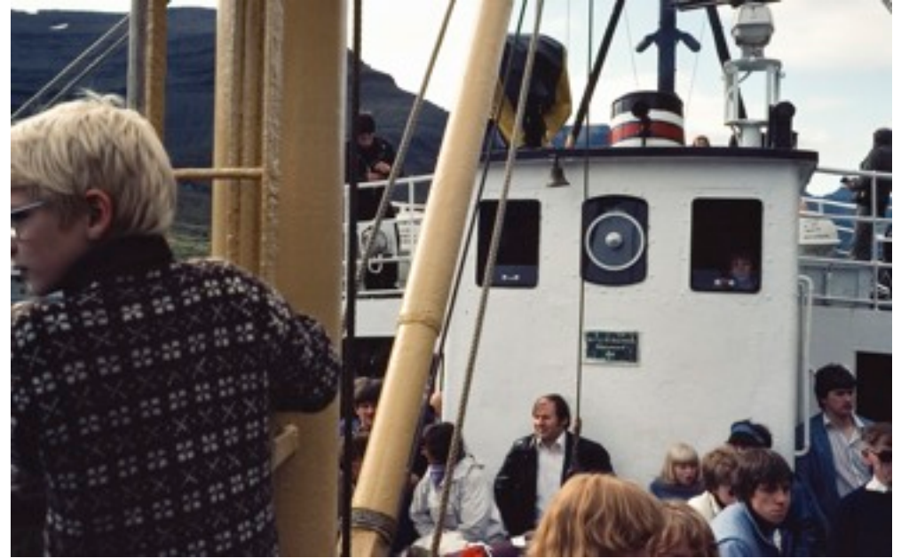
Klaksvík och båtresa till Fugloy