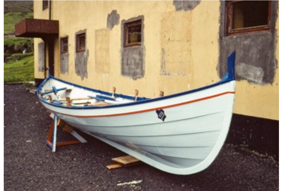
i väntan på kapprodd