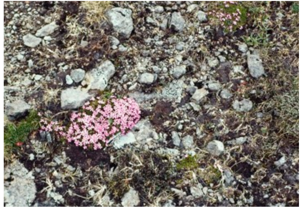
På väg ner mot Kvivík