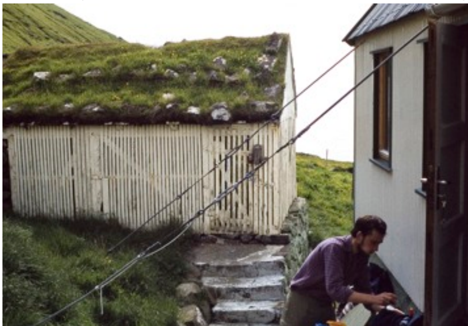
observera husets förankring!