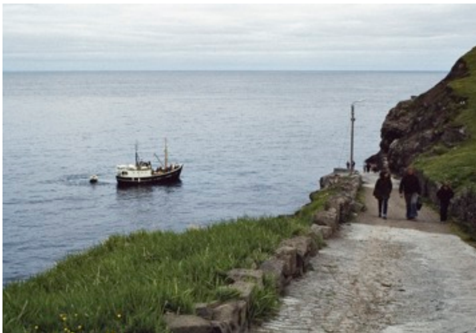
ankomst till Fugloy 19/6,