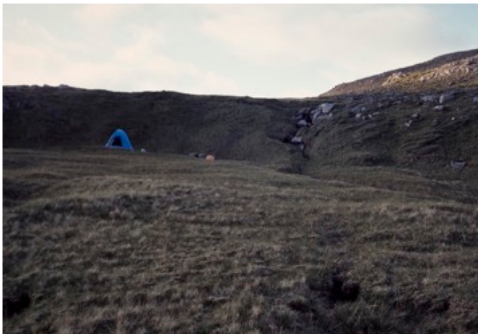
Tältplatsen 16-17/6 på fjället mellan Vestmanna och Kvivík