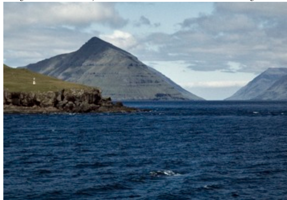
till höger: Klaksvík