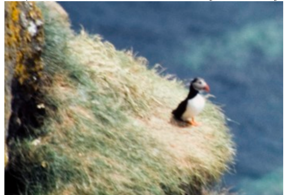
min enda, suddiga, bild av en lunnefågel