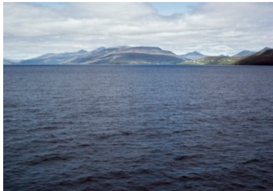
På väg mot Klaksvík med färjan Teistir

19:30 var vi framme på Fugloy och hittade lätt huset som var hyrt för oss. Vi gick in och pratade med det andra gänget som hade varit här i två dagar, och passade på att laga middag och äta i köket medan de var ute på kvällspromenad. Eftersom de fortfarande hade en natt kvar, reste vi tältet utanför huset och går nu till kojs i den relativt milda kvällen med utsikt över öppet hav och östra Svinoy's branta stup.