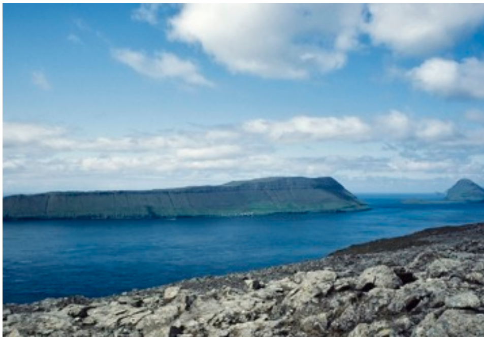
på väg till Kirkjubøur