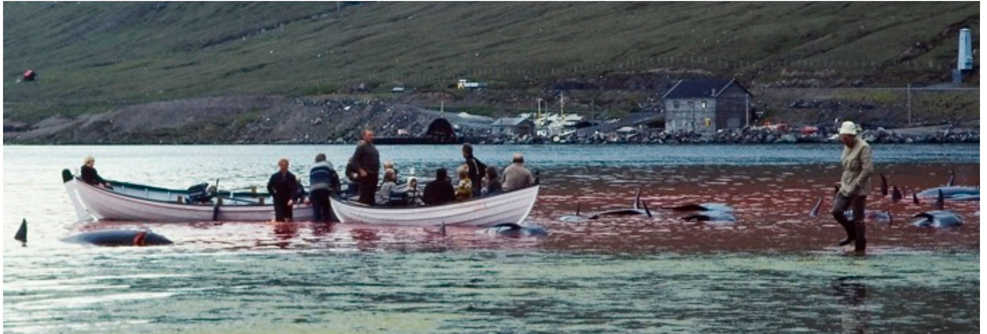
Grinddráp, folknöje nummer ett