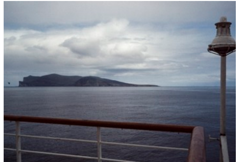
Shetlandsöarna passeras i gråväder

Shetlandsöarna såg mystiska ut, mörka disiga mitt i havet. Med kikare kunde man tydligt se bostäder, radarlänkstationer och ett observatorium (?). Bara på ett par ställen var stranden hög och brant, i övrigt såg öarna ganska tillgängliga ut så här på avstånd, men skenet kan bedra.