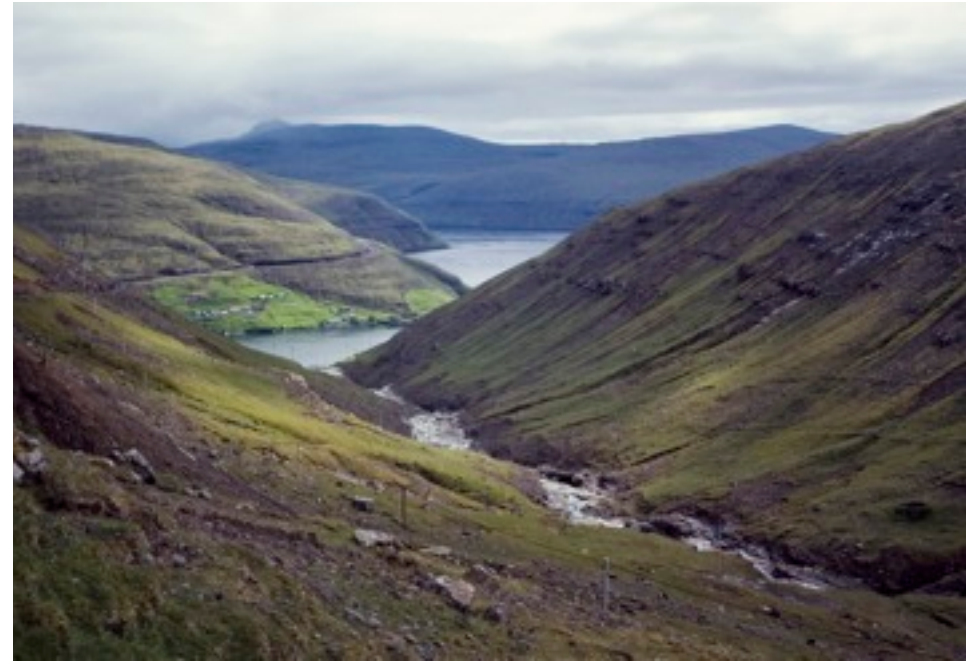
Vandring upp på fjället från Vestmanna