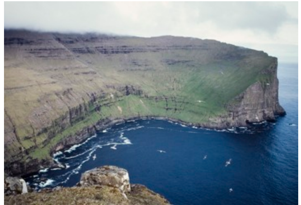
Fågelklipporna på Fugloy från tältplatsen