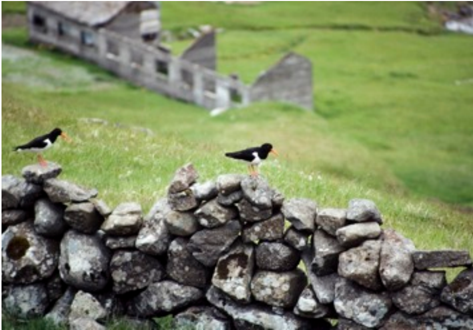
Tjaldur på muren runt Kvivíks inmarker